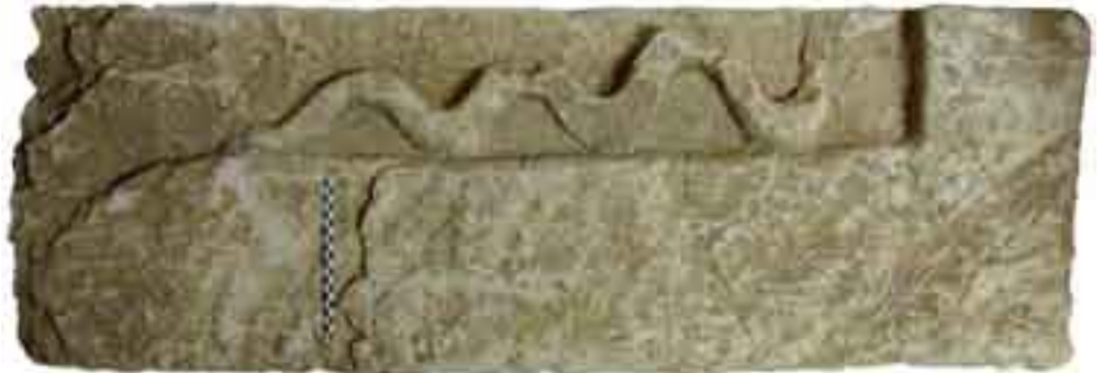
2008 Marquise «pierre au serpent» temple 4 ème siècle

Contact : stephane.revillion@culture.gouv.fr