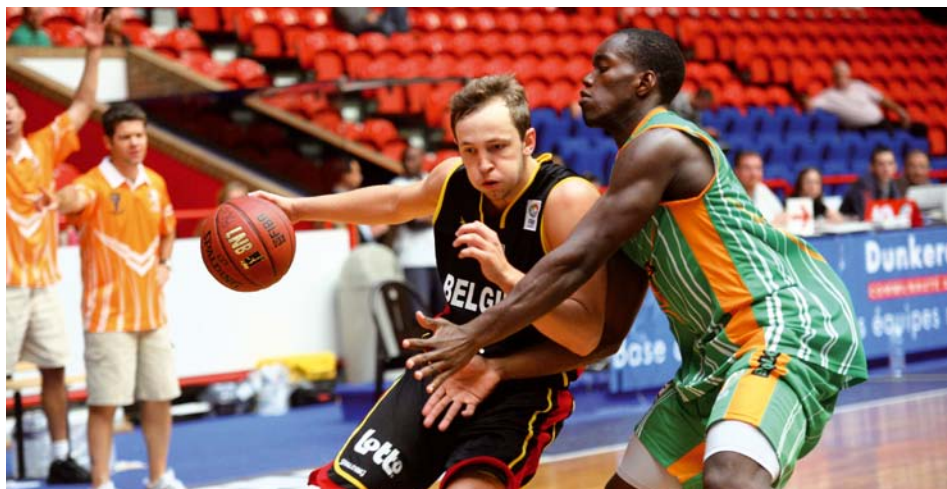
Cet été a eu lieu la Summer League de Basket-Ball réunissant les équipes de France (-20), Belgique, Centrafrique, Côte d'Ivoire et Qatar