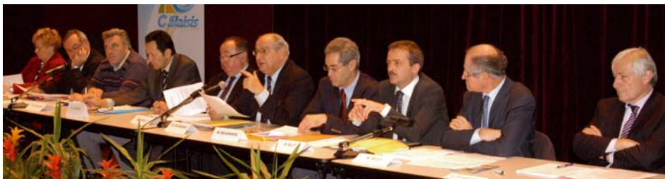
Lors du Comité Syndical du 27 novembre, les membres du SMCO ont voté à l'unanimité une motion concernant l'intégration des IFSI dans la réforme Licence-Master-Doctorat